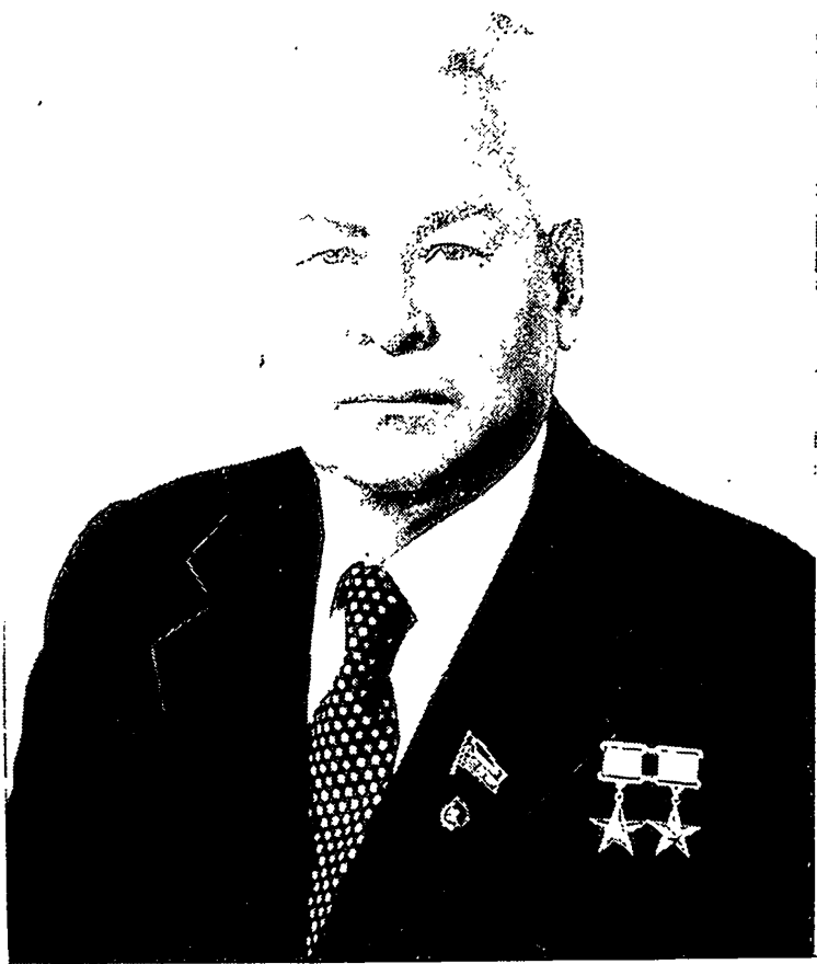
Генеральный секретар ЦК КПРС Костянтин Устинович ЧЕРНЕНКО