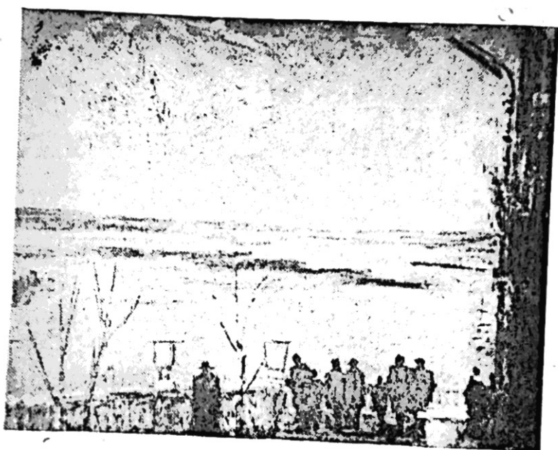
С. Шишко. Київська далечинь.