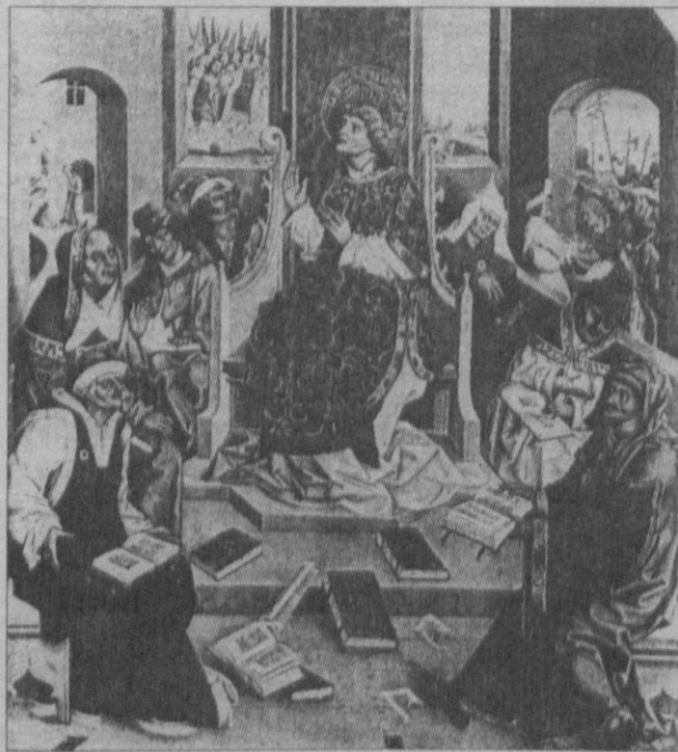
Ян Поляк. Диспут св. Стефана (бл. 1484; Стара Пінакотекка, Мюнхен)

Володимиром Бецом книги «Исторические деятели Юго-Западной России в биографиях и портретах» (вип. 1, Київ, 1883). Книжка Федора Уманця про Мазепу має назву «Гетман Мазепа» (а не «Гетьманство Івана Мазепы») й вийшла 1897 року в Санкт-Петербурзі, а не 1916 року в Києві. «Історія України-Русі» Миколи Аркаса