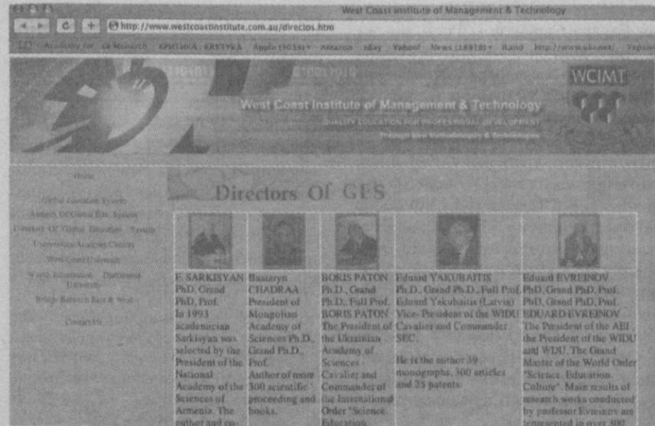
Рада директорів GES (Global Education System), складником якої є WIDU

Навпаки, загальноновизнаним (не так у світі, як в Україні, хоч і в світі подекуди також) є те, що українська освіта і наука в глибокій, системній кризі, поточена корупцією, недотриманням елементарних педагогічних зобов'язань, абсурдним перенавантаженням викладачів (що мають викладацьких годин десь удесятеро (!) більше, ніж американські), недофінансуванням, інфляцією, штампуванням дипломів і продажем академічних звань. Про останнє ми вже чули з перших уст. Але й про загальну кризову ситуацію промовисто пише академік Дробноход у своєму виступі «Сьогодення і проблеми вищої школи України» 14 ; доктор Стріха своєю чергою децю наголошує, зокрема проблему недофінансування, – але ні той, ні той якось не пов'язують цей сумний стан української вищої освіти, її системні негаразди з адекватністю, достовірністю, придатністю тих звань,