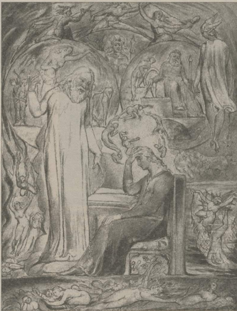
Вільям Блейк. Платонів дух (із ілюстрацій до Мілтона, 1816)

Проте поезія, хоч би якою щедрою була її краса, є безумовно авторитарною формою декларації. Вона покликається на себе одну, суперечить аргументові,