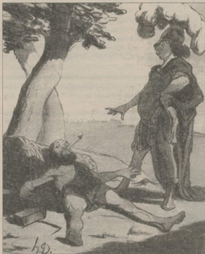
Оноре Домье. Александр і Діоген (1842)

Третій анекдот зводить на одній сцені двох протагоністів. Платон каже Діогенові: «Якби ти служив Діонісію, не мусив би мити овочі». Відповідь