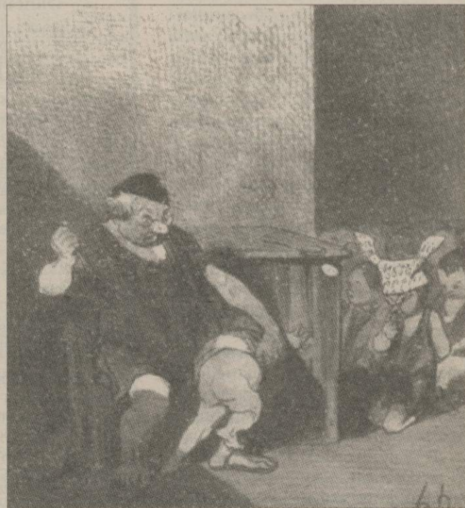
Оноре Домье. Тиран Діонісій (1842)

Тож хто, після Діогена, перебуває по цей бік барикади? Разом із ним – сократики. Справді, вони вважають, що найбільше благо – опанувати себе, звичайно, правити імперією, але імперією своїх пристрастей, свого життя, свого повсякдення. Поки стоїки вплутуються в життя імперського полісу, епікурейці беруться до розбудови дивовижних екзистенцій і надзвичайних стосунків. Як-от кампанійське епікурейство і римський сад на неаполітанській ділянці у Філодема з Гадари два століття після першого саду в Атенях. Влада над собою, творення філософських життів, спільнот друзів: ці наміри розвертаються подалі від компромісів із Пізоном, Цезарем та іншими фантомами Александра... Епікурейське життя триває шість століть: від Епікура до Діогена з Еноандив Анатолії III століття християнської ери. Подалі від міражів двору витворюються дива індивідуальних перетворень. Християнство стає офіційним у часи Константина, який легалізує полювання на все, що протистоїть його секти: переслідування, екзекуції, заслання, руйнування споруд, спалення бібліотек, заборона вчень. Гидкий час для філософів, особливо для учнів Епікура. Протягом цього часу отці Церкви зміцнюють центральну владу за допомогою войовничих тез і аргументів. Парадоксально, але опір християнству є... християнським. Супроти змішання духовного й ефемерного християни-інакодумці пропонують інший спосіб посилатися на Христа. Монастирська та анахоретська чернеча братія насправді пропонує по-своєму продовжувати епікурейську практику: споруджування