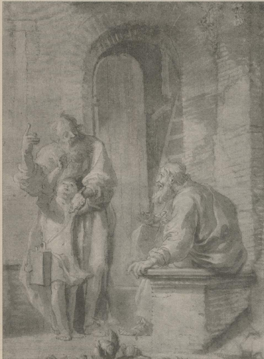
Нікоlaus Кнупфер. Платон і Діоген, який збиткується з Платоновим означенням людини (середина XVII століття, Кунстгале, Гамбург)

Починаючи від II століття нашої ери аж до XVII ця незнана, забута, непомічена, прихована течія зі своїми пантеїстичними та вільнодумними ідеями протистоїть місцевим властям, але не чинить спротиву владикам