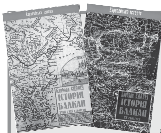
Барбара Єлавіч Історія Балкан XVIII і XIX століття. Том I Київ: СВЕНАС, 2004

Загалом порушена в цій праці проблематика, поза сумнівом, надзвичайно актуальна для сучасної естетики. Разом з тим, зважаючи принаймні на багатий фактографічний матеріал, до неї варто звернутися не лише естетикам, але й культурологам та усім, хто цікавиться проблемами культури. Показуючи культурну кризу сучасності, автори також прагнуть відшукати можливі шляхи виходу з неї. Цінною ця праця є й у методологічному плані, оскільки подає варіант певних засад дослідження «виявів» стихій в історії людської культури. □