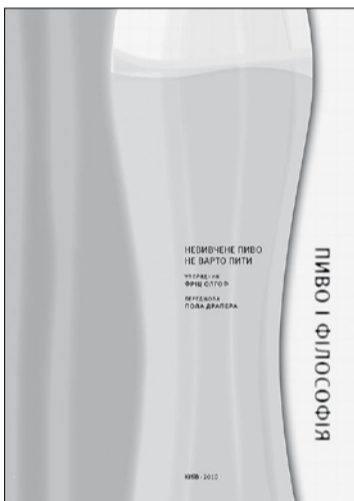
Пиво і філософія Невивчене пиво не варто пити Упорядник Стивен Д. Гейлз Переклад з англійської Петра Тарашука Київ: Темпора, 2010

Рибентропа 1939 року). Хоча Джуліан Асанж і компанія продемонстрували, що протокол навіть найтаємніших переговорів може опинитися на чільній шпальті «New York Times», жодного з них не запросять на розв'язання ізраїльсько-палестинської кризи, підписувати торговельні угоди між Азербайджаном і Росією чи встановлювати політику охорони довкілля на саміті G-20. Сьогодні, як і завжди, ці завдання перебувають у компетенції дипломатів. Як агенти держави, наділені можливістю формувати дискурс і впливати на громадськість через традиційні медіа, міжнародні дипломатичні еліти досі задають тон. І хоча скандал із «WikiLeaks» трохи дисциплінує дипломатичні корпуси разом із держсекретарем Гіларі Клінтон, до смерку їхньої влади ще далеко. □